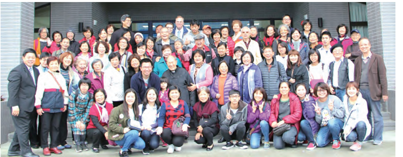
▶神長與教友們在八里台灣安老院前歡喜大合照