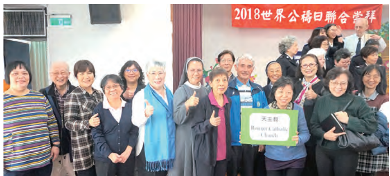
▲天主教會代表在世界公禱日聯合崇拜活動後歡喜合影

此外，台灣是2023年《世界公禱日手冊》撰寫國，也被選定為2023年的代禱國家，世界各地的基督宗婦女都會為台灣祈禱，屆時相關基督宗派將組織跨教派之撰寫委員會，「世界公禱日國際委員會」執行主任奧利維拉亦會來台參與。