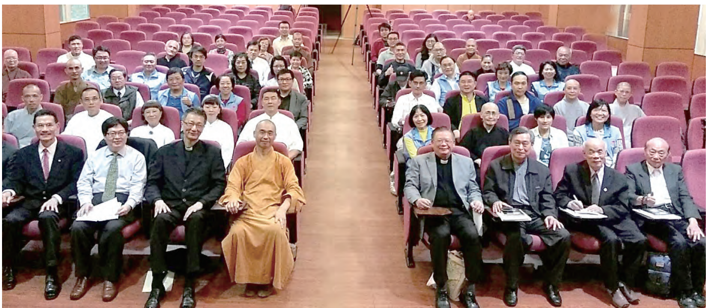
▲在護家盟促成下，台灣宗教界的先進於3月4日在天主教台北總主教公署舉行宗教法研討會。

台灣的天主教信徒雖然人少，但一向樂於為政府、民眾服務，而宗教交談是天主教的文化，教宗方濟各常以身作則，所以，我們十分支持護家盟於3月4日下午在台北總主教公署友倫廳舉辦的「宗教團體法研討會」，為促進宗教團體間在這一重要議題上的溝通，有助政府理解宗教團體的訴求，雙方