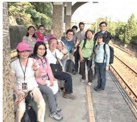
▲徒步朝聖者在月台上合影

到了燈塔區，主辦單位在涼亭區布置了露天祭台，我們12時30分舉行彌撒，由聖母聖心愛子會西班牙籍的范凱令神父主禮，谷寒松神父、杜晉善神父和韓國籍的朴圭雨神父共祭。范神父在致候詞說我們這樣的戶外彌撒和耶穌時代的傳教方式一樣，當時的信友們也像我們現在一樣，全都坐在地上，聆聽主耶穌的福音，神父也分享了西班牙的前輩傳教士們來到台灣福傳的故事，和初期教會教友們徒步朝聖的意義，雖然大部分的朝聖者都凶多吉少的客死他鄉，