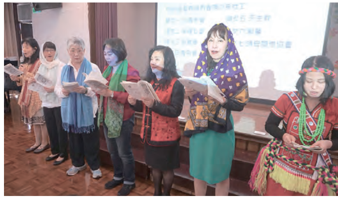
▲代表蘇利南共和國不同族群的婦女們，介紹生活的現況。