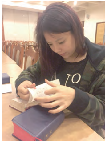
▲饗愛慕道班在甄選禮之前特別舉行大會考，了解慕道友的體會程度。 ▶四旬期第二主日的彌撒中，在聖母無原罪主教座堂舉行候洗者登錄。