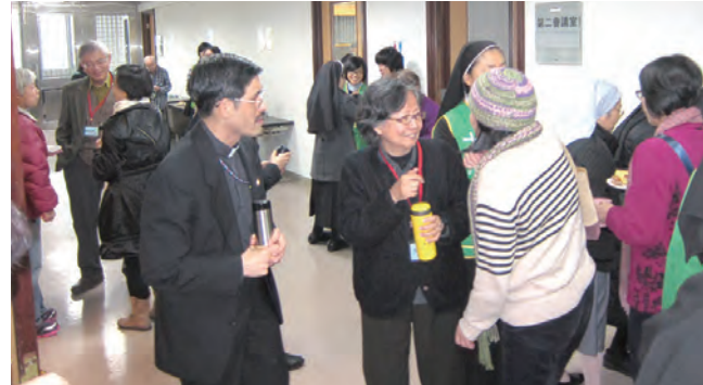
▲茶敘時間，舊雨新知，開心交談，從昔時到今日都是美好回憶。