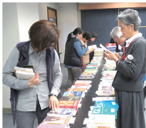
▲會場展出的歷年精彩出版品，吸引大家的注目。▼從四面八方而來的參與者，擠滿會場。