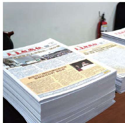
▲感謝《天主教周報》提供介紹聖博敏神學院在台金慶系列的各期報紙，在會場上贈閱。