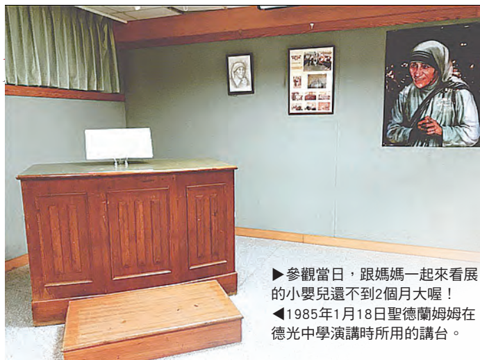
▶參觀當日，跟媽媽一起來看展的小嬰兒還不到2個月大喔！ ◀1985年1月18日聖德蘭姆姆在德光中學演講時所用的講台。