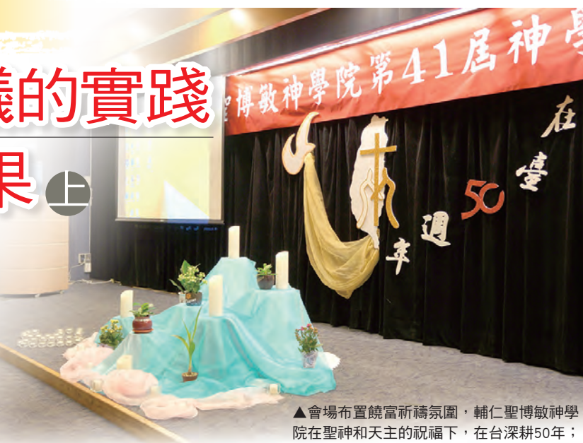
▲會場布置饒富祈禱氛圍，輔仁聖博敏神學院在聖神和天主的祝福下，在台深耕50年；未來仍需要上主沛賜恩寵，引領前行。

今年輔仁聖博敏神學院慶祝在台50周年，於1月26-27日舉辦神學研習會及慶祝餐會，邀請校友回娘家，與熱忱關心華語神學教育的貴賓歡聚一堂，共同回顧輔神在台灣教會這半世紀，一路走來的來時路和豐碩的初果；並以感恩祭宴，向天主獻上無限的感恩與讚頌！因為內容豐富，我們分作多次報導，以饗讀者，並歡迎大家一起來參與神學培育的事工。