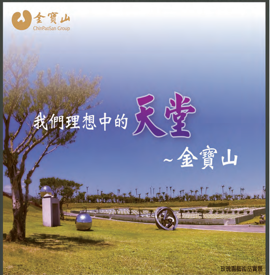
玫瑰園藝術品賞景